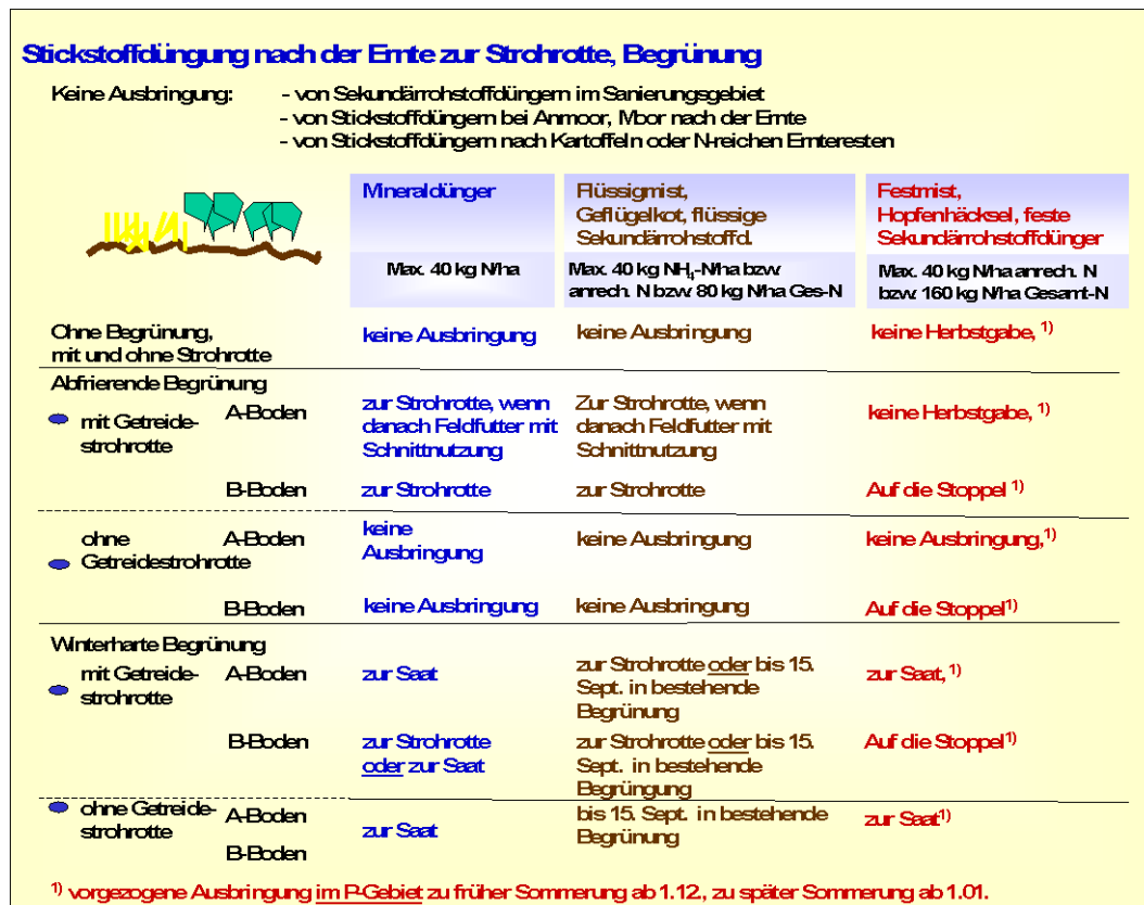
Abb. 7: Stickstoffdüngung nach der Ernte in Problem- und Sanierungsgebieten zur Strohhrotte oder Begrünung vor dem Anbau einer Sommerung im Folgejahr