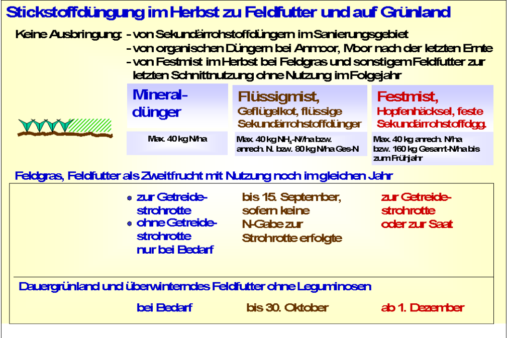
Abb. 8: Stickstoffdüngung im Herbst in Problem- und Sanierungsgebieten zu Feldfutter und Dauergrünland

Nach der SchALVO müssen dabei für mindestens 50 % der jeweiligen Schläge Messergebnisse vorliegen.