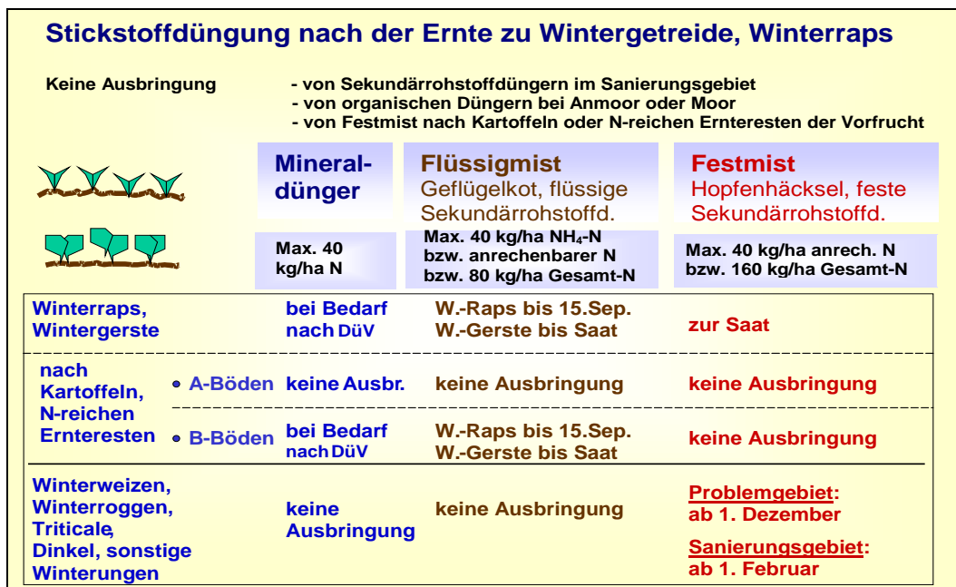
Abb. 6: Stickstoffdüngung nach der Ernte in Problem- und Sanierungsgebieten zu Wintergetreide und Winterapps

Durch die Schutzbestimmungen sind evtl. Anpassungen nötig. Die Lagerkapazität ist ggf. auszudehnen, die Lagermöglichkeit anderer Betriebe oder von Gemeinschaftsbehältern ist auszunutzen, flüssiger Wirtschaftsdünger muss ggf. abgegeben werden.