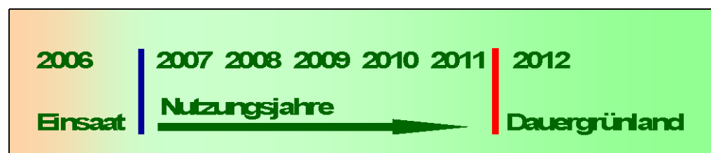
Abb. 3: Beispiel zur Definition von Dauergrünland