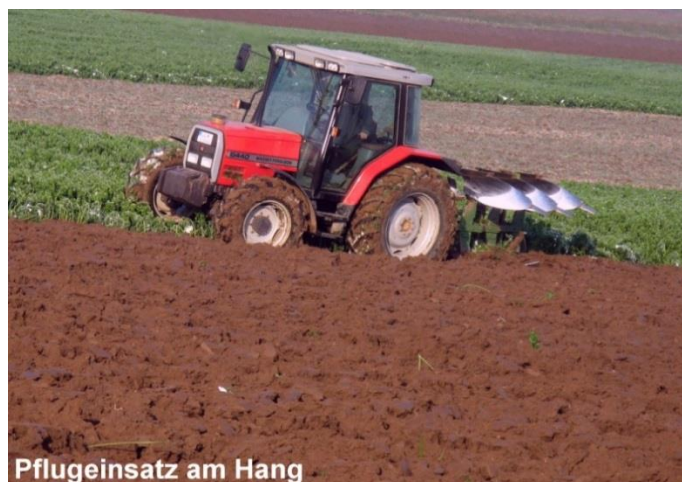
Pflugeinsatz am Hang

ACHTUNG: Neue Berechnung der Erosionsgefährdung seit 2017 - Bitte prüfen Sie Ihr Flurstücksverzeichnis!